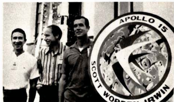
Gli astronauti della missione «Apollo 15». Da sinistra: James Irwin, Alfred Worden e David Scott.

«La velocità non è un granché, ma la tenuta di strada è buona», ha detto David R. Scott, comandante di «Apollo 15», parlando del LRV (Lunar Roving Vehicle), l'originale automobile che lo porterà in giro sulla superficie lunare. La partenza della missione «Apollo 15» da Capo Kennedy è prevista per il 26 luglio. Mentre l'astronauta Alfred M. Worden piloterà il modulo di comando, David R. Scott e James Irwin esploreranno la crosta selenica in tre riprese, per un totale di 21 ore. Il veicolo spaziale è stato modificato in modo da poter accogliere un carico di provviste e di strumenti scientifici doppio rispetto alla precedente impresa.