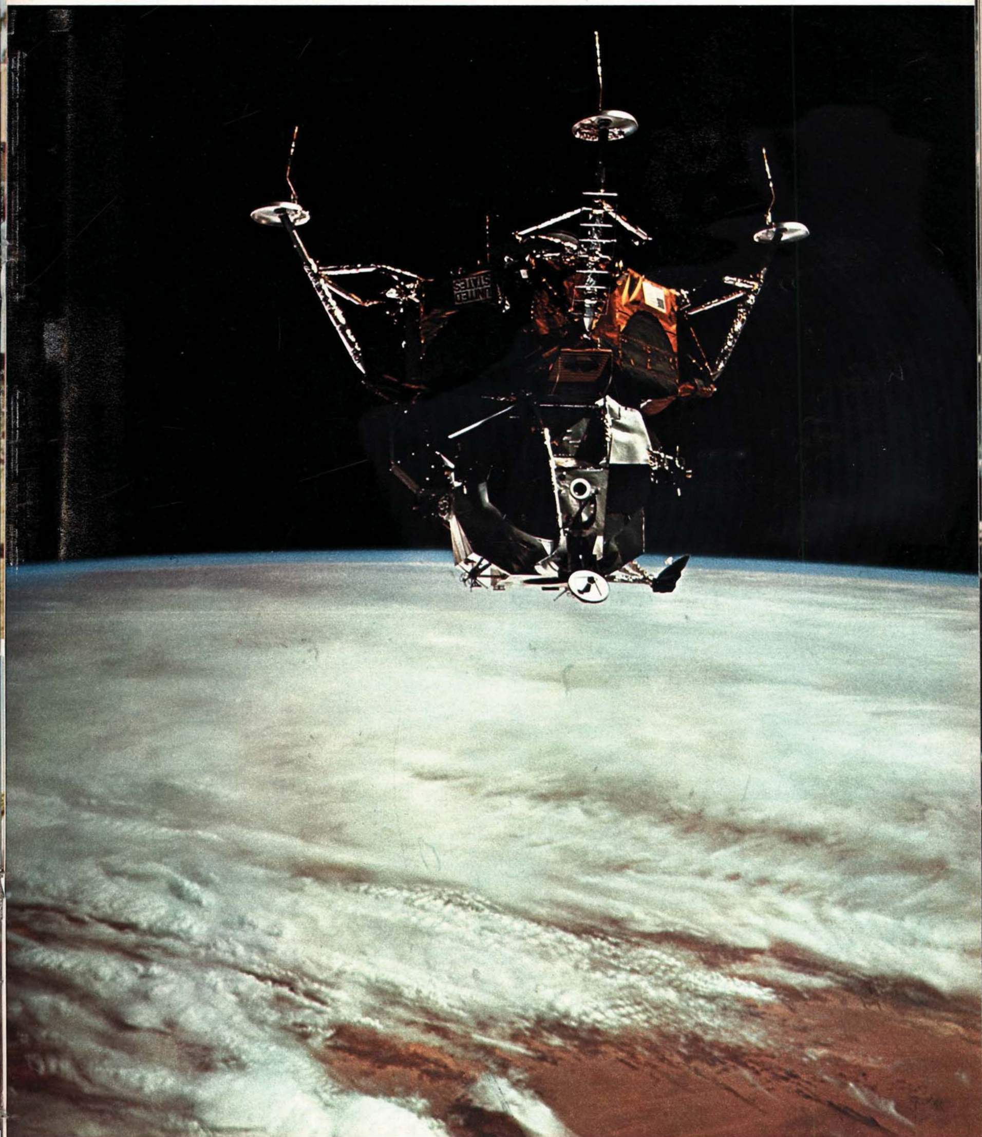
Staccatosi dall'Apollo 9, il Modulo vola lontano dalla nave-madre, dopo essersi dato una spinta con i propri motori. L'eccezionale fotografia è stata scattata da David Scott, rimasto ai comandi della capsula Apollo, mentre McDevitt e Schweickart guidavano il « Ragno », che era già in « posizione da sbarco ».