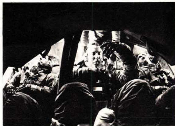
I tre astronauti del progetto Apollo 8 fotografati nell'interno della capsula durante un'esercitazione a terra. Da sinistra, William Anders, James Lovell e Frank Borman. Quest'ultimo, che ha 40 anni, è il comandante dell'astronave.

È dunque deciso: la mattina del 21 dicembre il missile Saturno 5 , la cui spinta è paragonabile a 160 milioni di cavalli (500 mila Ferrari «accese» tutte insieme), solleverà nello spazio tre astronauti americani, Frank Borman, James Lovell e William Anders, diretti verso la Luna. Non per discendervi, beninteso, ma per girarvi intorno più volte, così bassi da vedere e fotografare il paesaggio selenico come mai finora è stato fatto. La missione Apollo 8 , questo è il suo nome, sarà il prologo al fatidico istante in cui un uomo poserà il piede su un mondo celeste diverso dal suo.