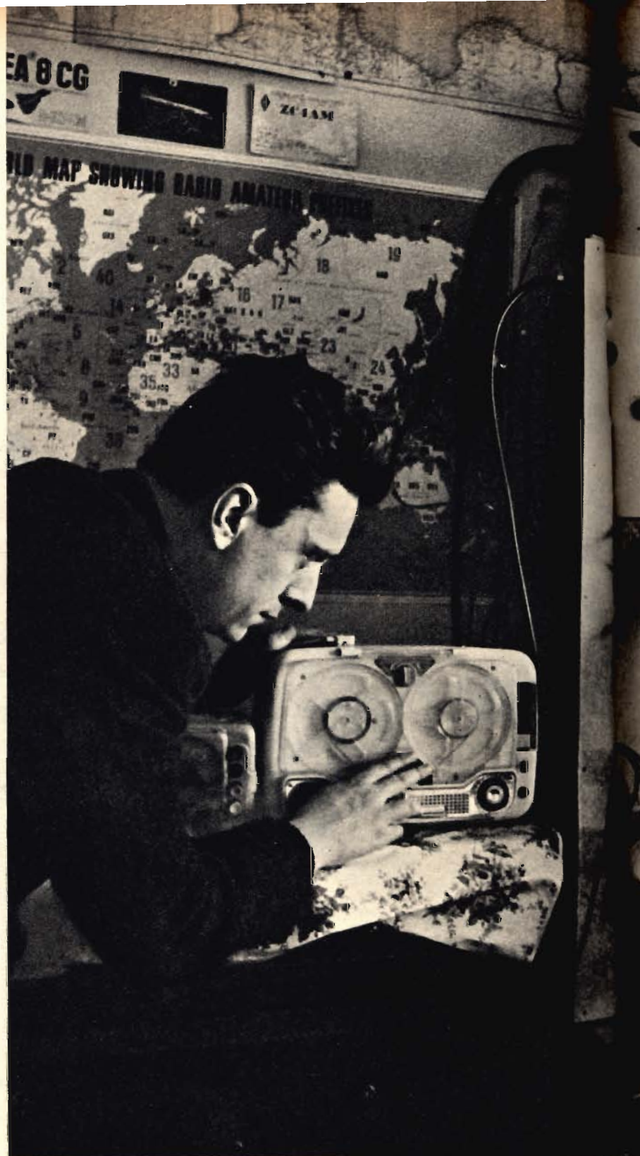
LA STAZIONE RADIO è situata al settimo piano d'un palazzo di via Accademia Albertina, a Torino. A circa 300 metri sul livello del mare, è isolata dagli altri caseggiati che potrebbero arrecare disturbi nelle trasmissioni e negli ascolti. La sezione ricevente è costituita da un apparecchio americano del tipo HRO, adatto alle lunghezze d'onda particolari dei satelliti lanciati nello spazio.

Che cosa rappresentava il segnale misterio-