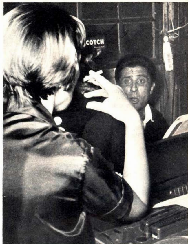
Gilbert Bécaud suona per la moglie, Kiki, un brano dell'opera lirica che ha composto. Egli desidererebbe rappresentarla alla Scala con l'intervento della Callas.