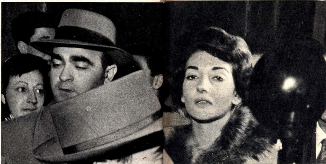
Maria Callas presenta un volto impassibile agli obiettivi dei fotografi, all'uscita dalla lunga seduta durante