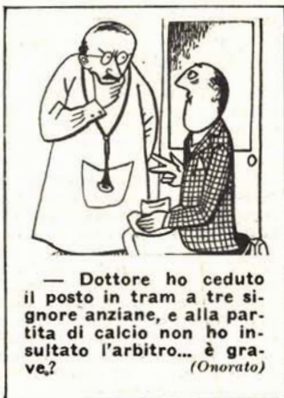
— Dottore ho ceduto il posto in tram a tre signore anziane, e alla partita di calcio non ho insultato l'arbitro... è grave? (Onorato)