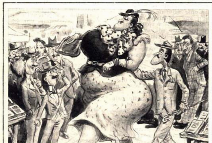
Il gagà che aveva detto agli amici: — Alla Fiera del Libro il volume di mia sorella ha destato vivissima impressione. (Attalo)