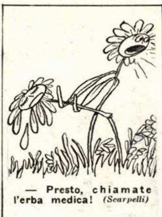
— Presto, chiamate l'erba medica! (Scarpelli)