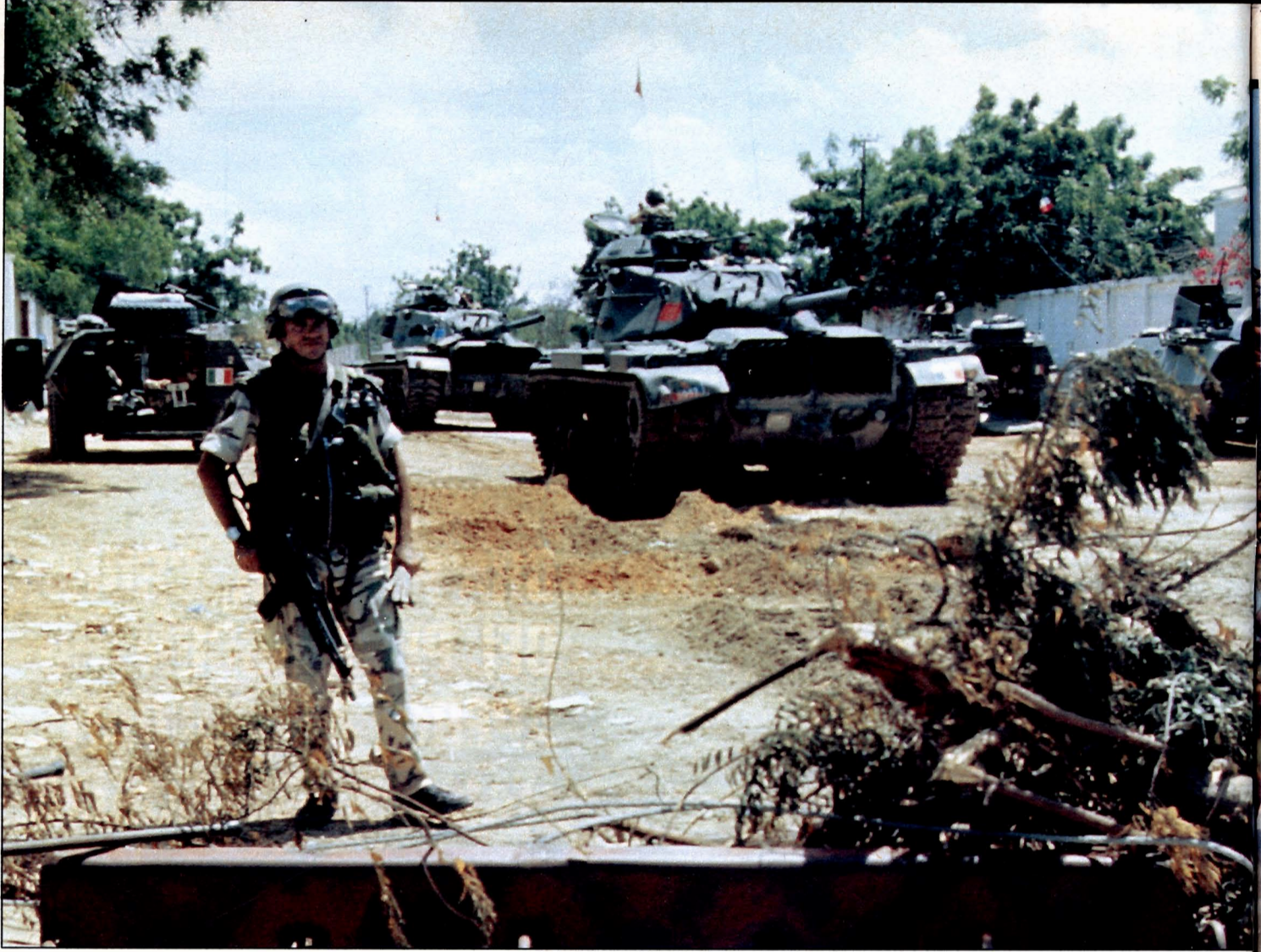
E. Malanca / Spiga Press