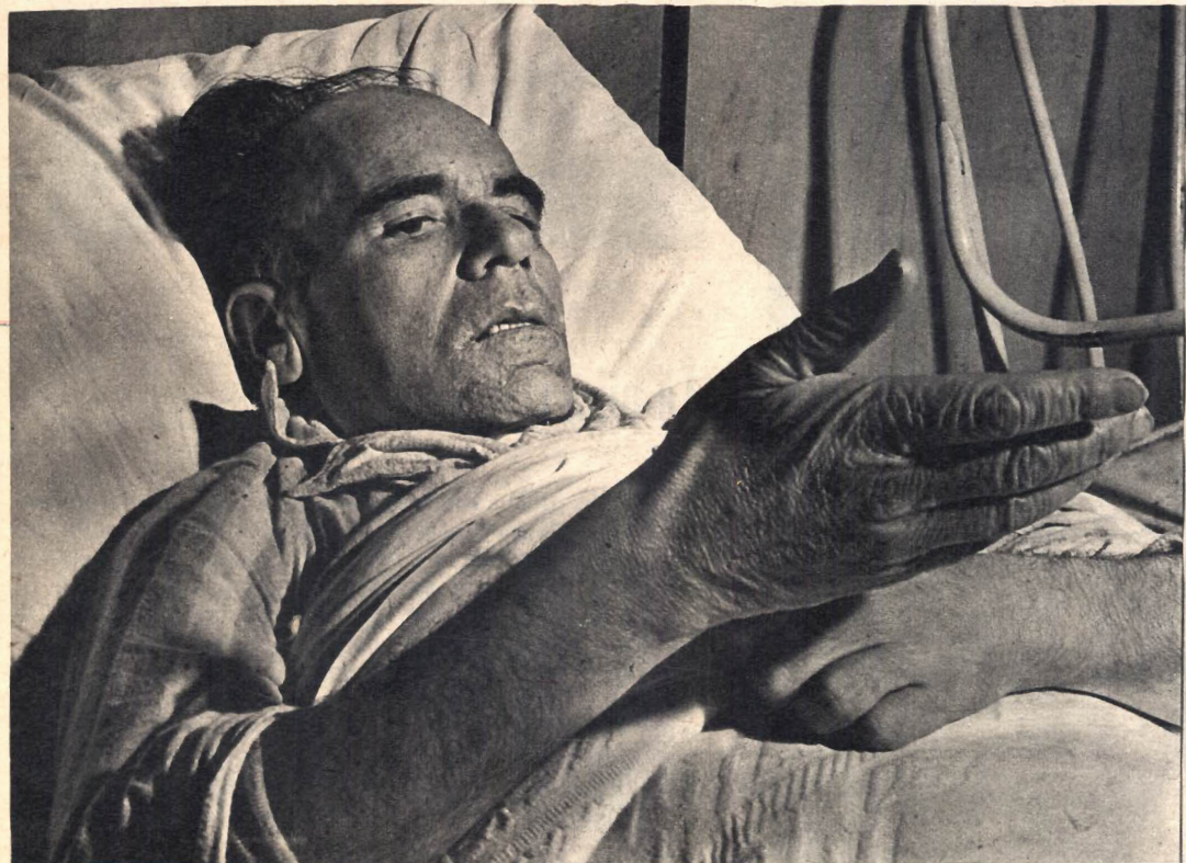
Non sono bastate le iniezioni. Non è bastato l'elettroshock. De Pisis non dorme. Ma non si dà per vinto. Dice che tornerà a dipingere. Prima dormire a lungo e poi tornare a dipingere.